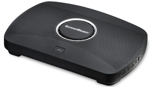
KATALOGNUMMER SBWD1100P ScreenBeam 1100 Plus Drahtloser Display-Receiver mit ScreenBeam CMS

Moderator- und Teilnehmer-Geräte haben verschiedene Verbindungsmöglichkeiten, einschließlich Miracast, lokalem WLAN-Modus, und Netzwerk-Infrastrukturen. Der neue HDMI-Eingang vereinfacht die gesamte Konferenzraumtechnik, senkt die Kosten durch Einsparung unnötiger Ausrüstung und erleichtert, gleichzeitig den Anschluss und die Anzeige für ältere Geräte die nicht über drahtlose Anzeigeanwendungen verfügen. Windows und macOS-Nutzer können Inhalte sowohl in duplizierten als auch in erweiterten Bildschirmmodi gemeinsam nutzen.